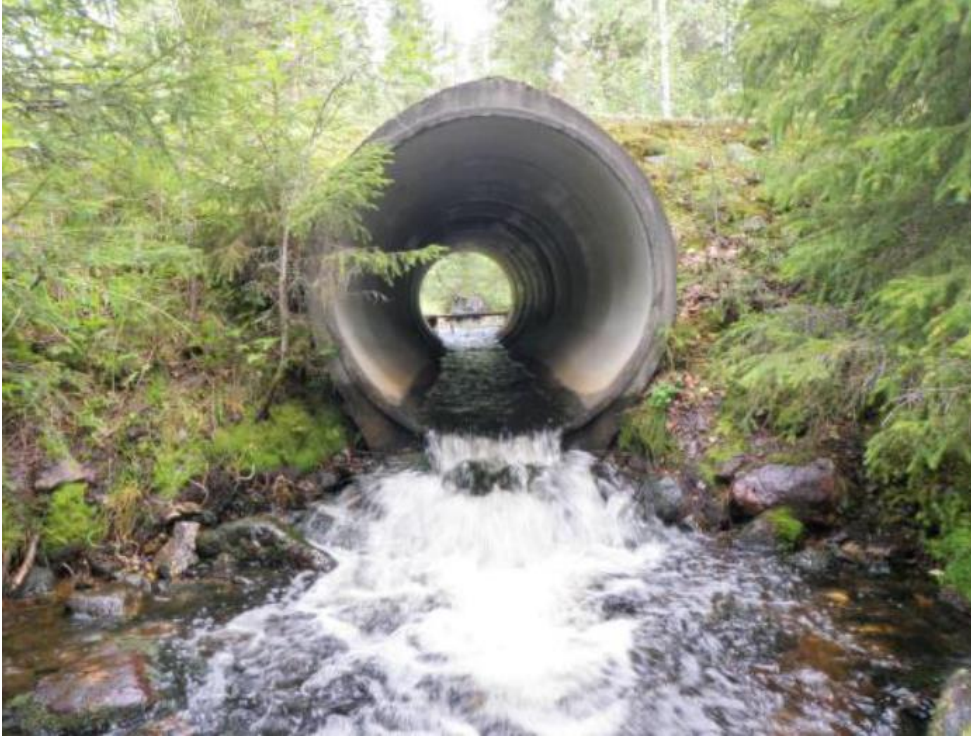
Kuva 7. Nousuesteenä toimiva rumpu.

Paikallis- ja metsäautoteiden ylittäessä puroja on ylitys järjestetty useimmiten rummulla. Jos rummun alapäässä on pudotusta tai rumpu on asennettu liian vinoon, se ei ole kaloille läpikulkukelpoinen. Suositeltavinta on korvata läpikulkuesteenä toimiva rumpu joko sillalla tai riittävän suurikokoisella rummulla, joka upotetaan osittain pohjamaahan. Tällöin uoman pohja rummun sisällä voidaan verhoilla kivillä, mikä helpottaa eliöiden kulkua ja voi jopa mahdollistaa elinympäristön muodostumisen taimenille rummun sisälle. Toinen vaihtoehto on vedenpinnan nostaminen rummun alapuolelle tehtävällä pohjakynnyksellä niin, että vesi nousee rumpuun asti ja mahdollistaa läpikulun.