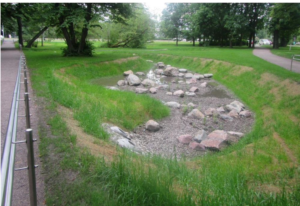
Kuva 5. Hulevesipuro, Helsinki.

Hulevesien syntymistä estetään rajoittamalla vettä läpäisemättömiä pintoja ja johtamalla vesi imeytymään tonttialueille. Viherkatot pidättävät suuren osan etenkin pienistä ja yleisimmistä sadannoista. Kattovedet voidaan johtaa imeytymään kivipesiin ja kattovesiä on perinteisesti kerätty kastelutarkoituksiin. Katoilta ja piha-alueilta tulevia vesiä voidaan johtaa kasvustoihin, sadepuutarhoiksi kutsuttuihin imeytyspainanteisiin tai pysyvävetisiin lammikoihin, jolloin hulevettä voidaan samalla hyödyntää pihasuunnittelussa. Hyvistä toteutuksista tarvitaan aina esimerkkejä.