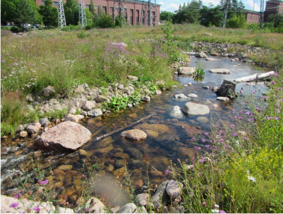
Kuva 8. Imatran kaupunkipuro.

Loiviin ohitusuomiin voidaan rakentaa myös poikastuotantoon soveltuvia olosuhteita kaloille, esimerkiksi taimenelle. Imatran kaupunkipuro Imatrankosken ja voimalaitoksen välisessä saassa toteutettiin poikastuotantouomaksi ja myös matkailukohteen uudeksi vesiaiheeksi. Nyt se tuottaa nyt enemmän taimenen poikasia kuin vastaavan kokoinen luonnonpuro. Kalateiden ja poikastuotantouomien rakentamisella voidaan palauttaa uhanalaisten vaelluskalojen vaellusyhteyksiä luoda korvaavia lisääntymisalueita hävinneiden tilalle, mikä on erityisen tarpeellista voimakkaasti muutettujen jokivesistöjen voimalaitosalueilla. Samalla voidaan saada aikaan kiinnostavaa uutta vesimaisemaa.