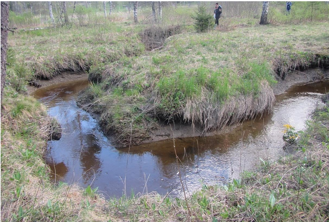
Kuva 2. Nuuksion Myllypuro. Kun vettä johdetaan vanhoihin mutkiin, on suoristettu ja usein eroosion takia syventynyt uoma täytettävä riittävän tiiviillä patorakenteilla.

Uomaan lisättävä kivi- ja puuaines toimii monimuotoisuuden lisääjänä ja sitä voidaan lisäksi käyttää myös hallittuun virran ohjaamiseen, esimerkiksi suoristetun uoman mutkittelun lisäämiseen ja voimakkaasti syöpyvissä uomissa eroosion hillitsemiseen. Aikoinaan suoristettuja ja perattuja uomia on ennallistettu jo runsaasti metsäalueilla joko palauttamalla kiviä takaisin uomaan tai johtamalla vesi vanhaan, usein kuivilleen jääneeseen uomaan. Maatalouden kuivatuksen yhteydessä suoristettuja uomia on ennallistettu kaivamalla uoma vanhoista kartoista ja ilmakuvista näkyvään paikkaan tai johtamalla vesi vanhoihin mutkiin.