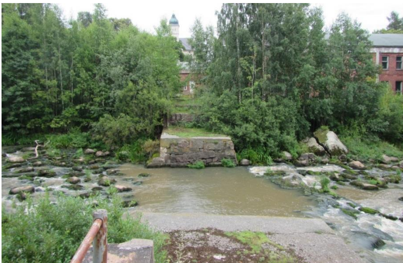
Kuva 6. Osittain purettu pato, Koskenkylä.

muodossa. Suomessa on toteutettu tai käynnissä useita hankkeita, joissa pato ainakin osittain puretaan ja pienen voimalan käyttö lopetetaan.